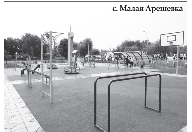
с. Малая Арешевка