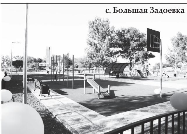
с. Большая Задоевка

В Кизлярском районе сдали в эксплуатацию объекты, построенные в 2022 году по программе «Формирование комфортной городской среды».