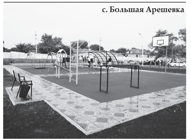
с. Большая Арешевка

Как было сказано, всего в текущем году сдано 7 площадок, направленных на благоустройство населенных пунктов и организацию досуга подрастающего поколения. Кроме того, на днях были подписаны контракты по строительству детских игровых площадок в отдаленных от райцентра населенных пунктах - в селах Новый Бирюзьяк и Брянск. Финансирование проектов будет осуществляться за счет средств бюджета МР «Кизлярский район». Также местной властью принимаются меры для строительства в текущем году детских игровых площадок в селах Огузер и Юбилейное, которые будут реализованы в рамках проекта «Местные инициативы».