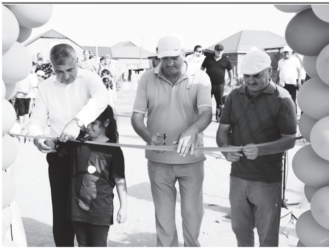
с. Большой Бредихин