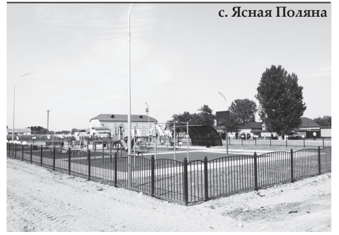
с. Ясная Поляна