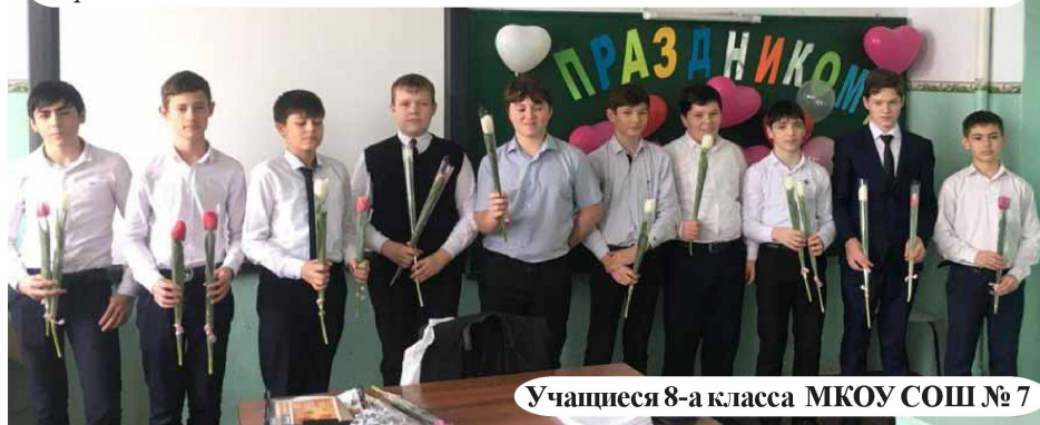
Учащиеся 8-а класса МКОУ СОШ № 7

Дорогие, милые дамы, самые очаровательные и восхитительные поздравляем вас с Международным женским днем! Желаем весеннего настроения, удачи и успехов в работе, в учебе, счастья и гармонии в семье. Здоровья вам и вашим близким. Пусть ваши глаза светятся счастьем каждый день! Вы очаровательны!