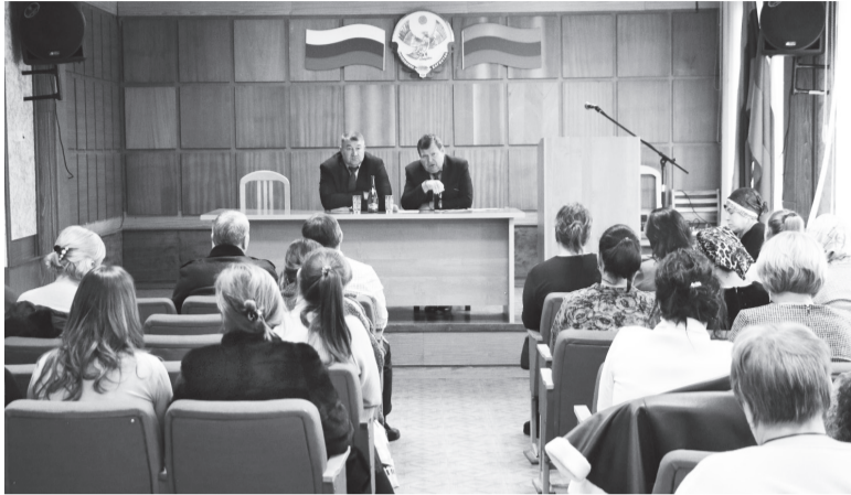
Глава Кизляра принял участие в составе дагестанской делегации в работе двухдневного

форума, главной целью которого стали обмен опытом руководителей муниципальных образований российских регионов, развитие местного самоуправления. Об этом он рассказал в пятницу, 19 января, активу города.