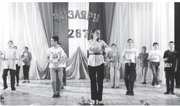
за доставленное им удовольствие.

Зрители тепло приветствовали выступление артистов и бурными аплодисментами выразили благодарность