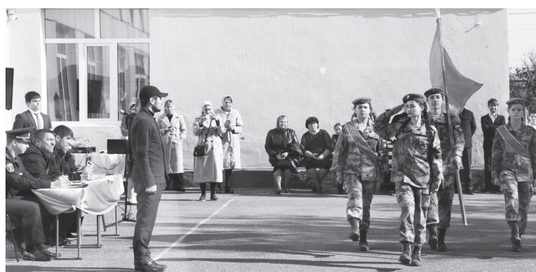
Пожелаем удачи знаменной группе гимназии №1 в республиканском этапе смотра-конкурса «Равнение на флаг»!

Доклад, вынос флага, представление флага, склонение флага, смена у флага, движение группы строевым шагом, проход торжественным маршем. Юнармейцы должны были выполнить все эти элементы строевой подготовки знаменной группы в совершенстве, чтобы получить